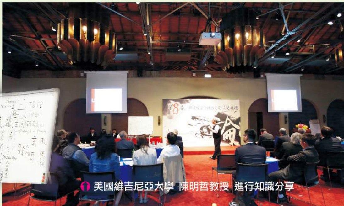
美國維吉尼亞大學 陳明哲教授 進行知識分享