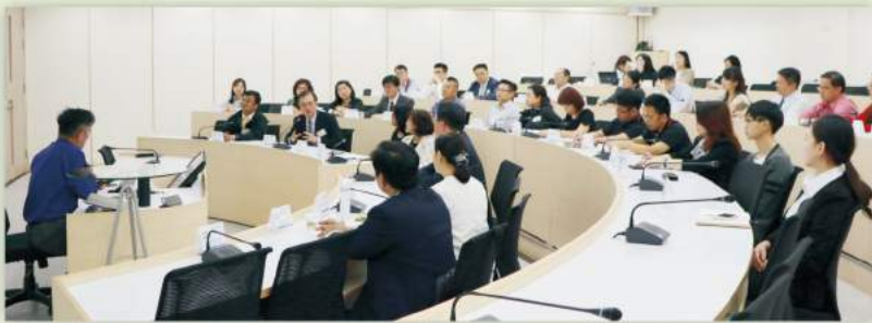
於會議室進行公司簡介與Q&A交流

創立於1980年的南京資訊，多年來致力於創新科技產品，主要為工業電腦 (IPC)、端點銷售系統 (POS)、資訊終端系統 (Kiosk)、航太級電腦系統、Panel PC、醫療電子設備、嵌入式系統...等，以領先的研發及生產技術並運用靈活的經營策略，成功的將自動化產品及嵌入式電腦產品行銷於世界各地，多項產品也榮獲台灣精品獎肯定，使得以在工業電腦的領域中領先群倫。「誠信篤實，勤奮積極，穩定成長」是南京資訊既定的經營理念，也因而贏得客戶的高度信賴。