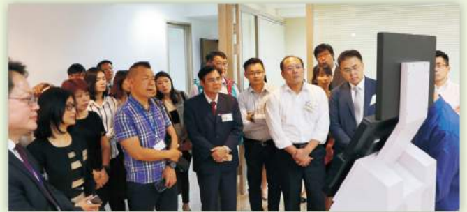
進行產品應用展示與說明