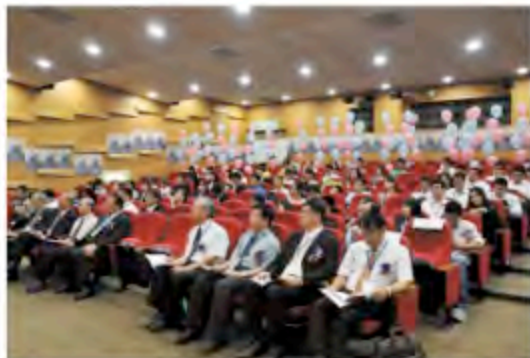
▲ 頒獎典禮出席踴躍