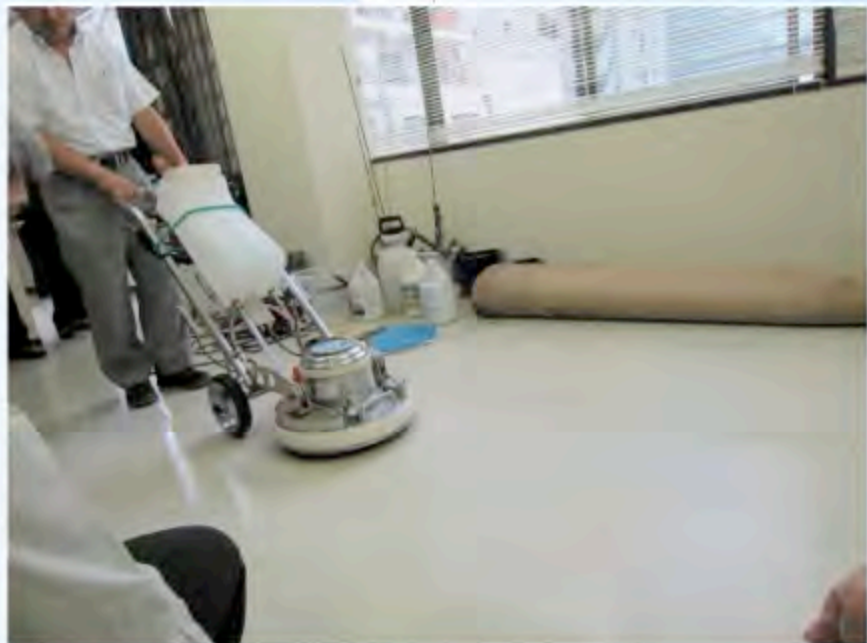
▲ 日本機器透過不斷改良研發便利使用者操作

練，經費成本就會降低，你的培訓期就會降低，成本就會降低。」許會長認為機器設備的知識與技術更新是本次觀摩最大的收穫，目前國內洗地機器為單盤式，而日本方面已經發展到三爪式，甚至是四方型的振動迴旋式洗地機，而樂活居健康產業合作交流會也將這樣的現今清潔產業國際發展的趨勢，帶回到國內作為日後產業參考的方向。