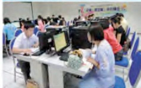
▲ 學員們認真地操作「中小企業簡易資金管理工具」