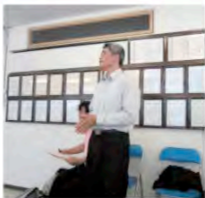
▲從許會長針對牆上日本清潔產業為數可觀的證照進行詢問

在觀摩互動的過程中，樂活居成員也了解到日本清潔業證照考試的專業與重要性。根據兵庫縣美妝協會介紹，日本清潔業證照考試除學科之外，術科考三大項。第一大項是地板清潔，第二大項是玻璃清潔，第三大項是地毯清潔。舉例來說，地板清潔就是包括從靜電、除塵，到拖地、打蠟、洗地上蠟等流程，玻璃清潔則主要是清潔玻璃前後兩面，測試玻璃清潔操作的順序與步驟是否正確，最後則是地毯清潔，包括局部去汙處理與整體清潔處理。「在觀摩過程中，我們特地請日本代表實地演練SOP操作模式，然後在旁邊錄影，希望把這一套SOP標準化制度給台灣。另