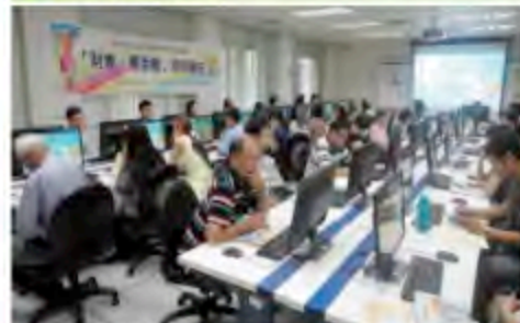
▲ 「財會 零距離」課程採全程電腦實機操作教學，教您一步一步學會軟體操作