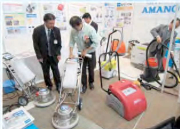
▲透過日本大型清潔展覽觀摩最新型清潔機器

「我們回國的當日，還有日本廠商就有一起坐飛機過來，也拿來許多商品。」許會長說，這次的觀摩行程，台灣的清潔業者對於當地美妝協會也造成一個轟動，該協會為了樂活居健康產業合作交流會這次參訪全程安排人員接待，充分展現合作誠意。「他們的玻璃上除水垢商品，也有拿來給我們試。試完我跟他講，還是有問題，所以請他回去改良，我這幾天去測試，他的金剛砂原本是軟海綿，我建議他用硬海綿，硬海綿跟軟海綿同樣他的金剛砂，速度加兩倍效率差兩倍。那他說他ok可以配合我們