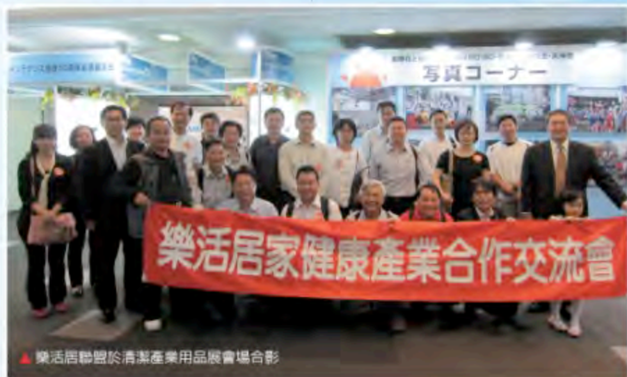
▲樂活居聯盟於清潔產業用品展會場合影

這是許會長未來最希望樂活居聯盟能作到的一個方向，是否能掀起這波產業的「寧靜革命」？就看是否能落實這枚改變清潔產業的震撼彈，相信也將帶給消費者全然不同的「煥然一新」感受。