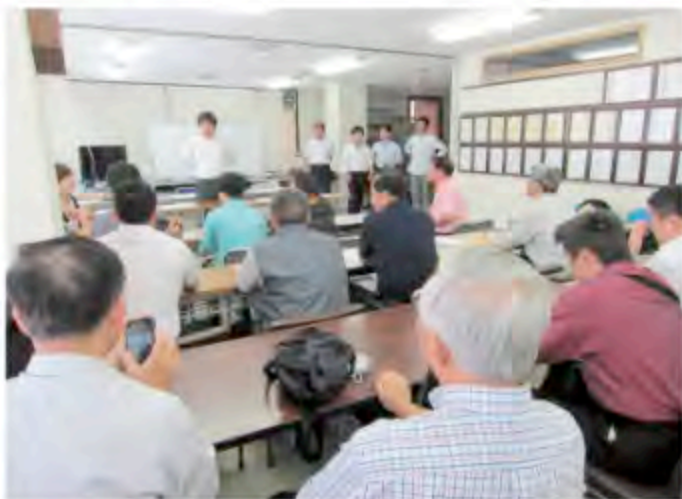
▲日本美妝協會代表向樂活居聯盟進行介紹

樂活居聯盟成員目前主要證照為「病媒防治專業技術人員及施藥人員」的證照，是聯盟內只要有在做消毒工作的從業人員，百分之六十以上都擁有專業技術人員證照，其餘的人員也都擁有施業人員的訓練證照。然而國內目前雖然在推行環境綠美化人員的證照，目前也經過環保署許可辦理相關訓練，但是因為尚未立法通過，故仍無由核發環保署核發相關的合法證照，但是樂活居未來仍會往這個方向努力。